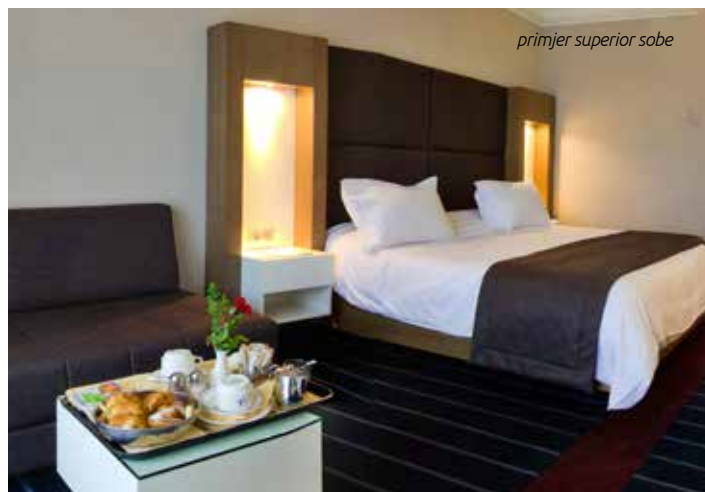
primjer superior sobe