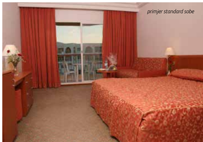
primjer standard sobe